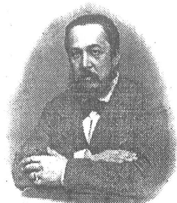
Граф Алексей Сергеевич УВАРОВ (1828-1884 гг.)

Пионером научных изысканий в Херсонесе стал известный знаток христианских древностей и организатор отечественной археологической науки граф А. С. Уваров. В 1853 году он исследовал одну из самых крупных базилик в северо-восточном районе города, в память об этом получив-